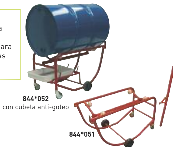
844*052 con cubeta anti-goteo