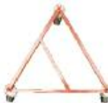
840*6955 Rodador para bidones de 60 a 220 litros