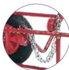
Ruedas para rotación