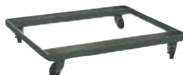
P16111763295 BASE RODANTE APILADOR DE SILLAS